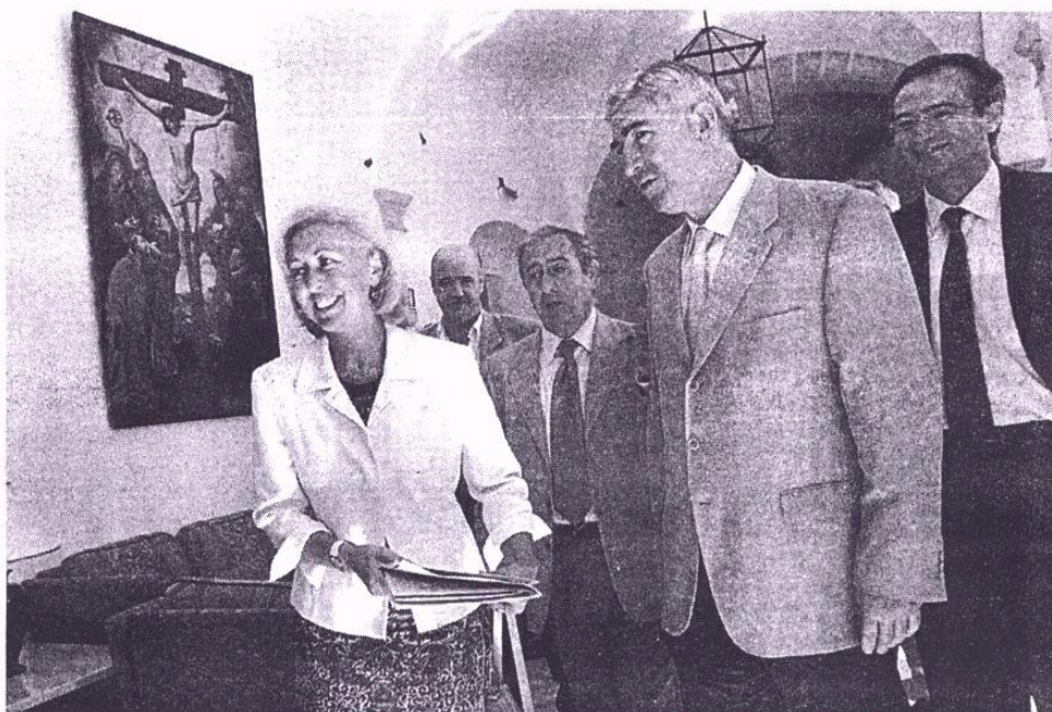
BIENVENIDA. La consejera de Medio Ambiente, a su llegada a las jornadas, en el hotel Monasterio

La consejera cerró las jornadas congratulándose de las distintas iniciativas que la Junta está promoviendo en este campo, en el que, según aseguró, Andalucía es pionera. Habló largo y tendido sobre un próximo decreto de reutilización de pilas y baterías, la-